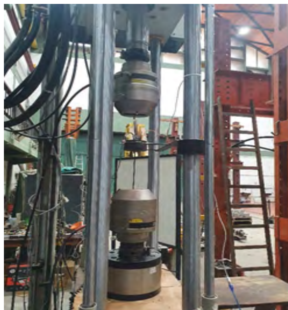
Figura 2: Equipo Instron con acelerómetros colocados.

Al resultado de estas mediciones se le aplicó la transformada rápida de Fourier, para poder convertir la señal desde el dominio del tiempo al dominio de la frecuencia.