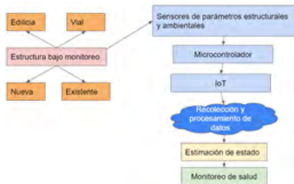
Figura 1: Sistema SHM mediante IoT

Se propone un sistema SHM esquematizado en la Fig. 1